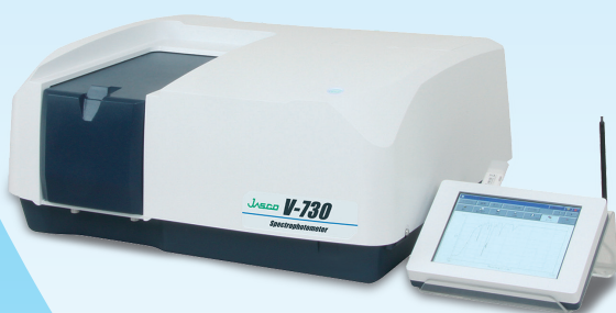
V-730 紫外可視分光光度計