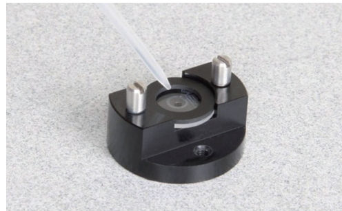
J-1500用 1滴測定アクセサリ