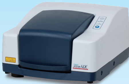
FT/IR-4X フーリエ変換赤外分光高度計