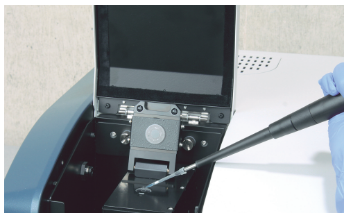
FP-8300用 1滴測定アクセサリ