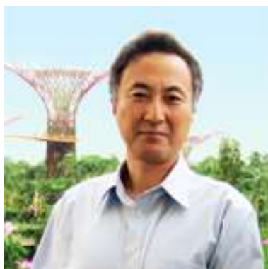
第43回日本分子生物学会年会年会長

Riding the crest of excitement from the XXXII Tokyo Olympic games, the Molecular Biology Society of Japan will hold its 43 rd Annual Meeting (MBSJ2020) in December, 2020. MBSJ2020 will provide a forum in which to meet new people, ask new questions or discover new ways of asking questions, and together reactivate basic research of life sciences. Our emphasis for MBSJ2020 is: “New Faces, New Questions, Revitalized Worlds”, and we particularly welcome MBSJ members who are doing innovative research, but who have not previously given a presentation. We equally encourage the participation of researchers from the vast proliferation of new fields and systems branching from molecular biology. The new questions that arise from such a diverse assembly are sure to revitalize fields that were previously overlooked or unchallenged. The highest priority will be on facilitating scientific discourse, with improved audio-visual systems, carefully organized symposia, workshops, and poster sessions. With the aim of attracting an international assembly of scientists, the scientific sessions of MBSJ2020 will be conducted entirely in English as the official language. We look forward to seeing you in Kobe, in December, 2020!