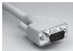
接続ケーブル側 (オス)